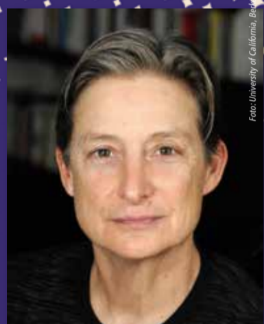
Judith Butler Maxine Elliot Professor University of California, Berkeley

Judith Butler, Maxine Elliot Professor in the Department of Comparative Literature and the Program of Critical Theory at the University of California (Berkeley), zählt zu den weltweit einflussreichsten Theoretikerinnen im Bereich der Feminismus- und Genderforschung. Im Mittelpunkt steht die performative Geschlechteridentität, die sich als Frage nach dem Verhältnis von Subjekt, Körper und Macht, sowie nach der sozialen und politischen Wirklichkeit entfaltet. Die Einsicht in die Gefährdung, in das Ausgeliefertsein und in die Verletzbarkeit des Anderen, führt zu einer Ethik der Gewaltlosigkeit, die auf dem Eintreten für Anerkennung und für gerechtere und demokratische Formen gründet.