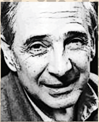
Professor John Searle Slusser Professor of Philosophy University of California, Berkeley

John Searle, 1932 in Denver, Colorado geboren, ist seit 1959 Professor für Philosophie an der University of California, Berkeley. Seit dem Erscheinen seines sprachphilosophischen Hauptwerkes Speech Acts im Jahr 1969 gilt er als einer der bedeutendsten und einflussreichsten Sprachphilosophen des 20. Jahrhunderts. Bahnbrechend waren für die linguistische Pragmatik vor allem seine frühen Ansätze zur Sprechaktheorie. Searles weitere Forschungsschwerpunkte betreffen vor allem Fragen aus dem Bereich der Philosophie des Geistes und der Sozialphilosophie; seine zahllosen Veröffentlichungen stellen markante Diskussionsbeiträge zu den Gegenwartsdebatten dar. Ein Schlüssel für die Rekonstruktion mentaler Zustände wie für die Konstruktion sozialer Wirklichkeiten bildet hierbei das Verständnis von Intentionalität.